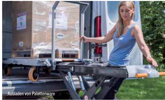
Ausladen von Palettenware