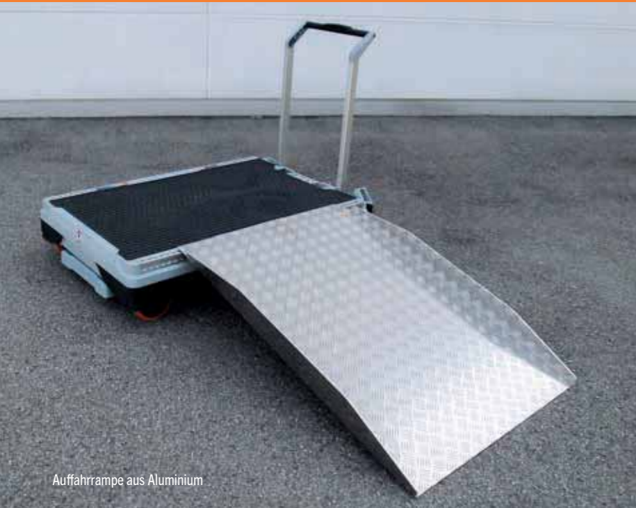
Auffahrrampe aus Aluminium

xetto® ist so individuell wie Ihre Anwendungen.