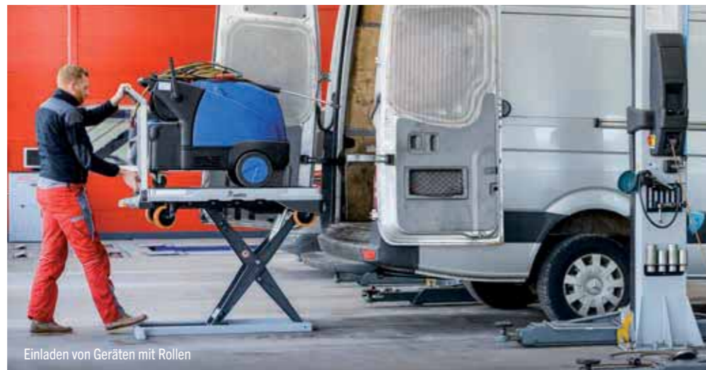
Einladen von Geräten mit Rollen