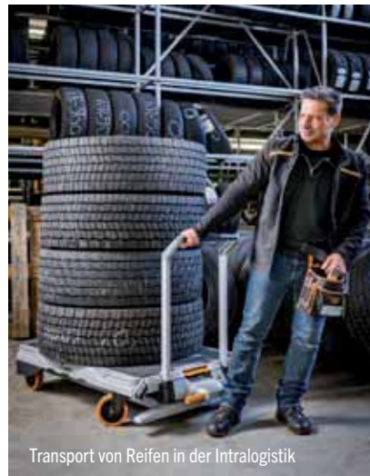
Transport von Reifen in der Intralogistik