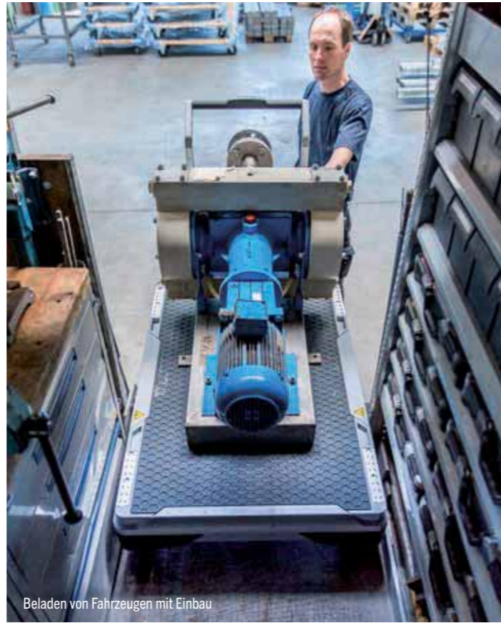
Beladen von Fahrzeugen mit Einbau