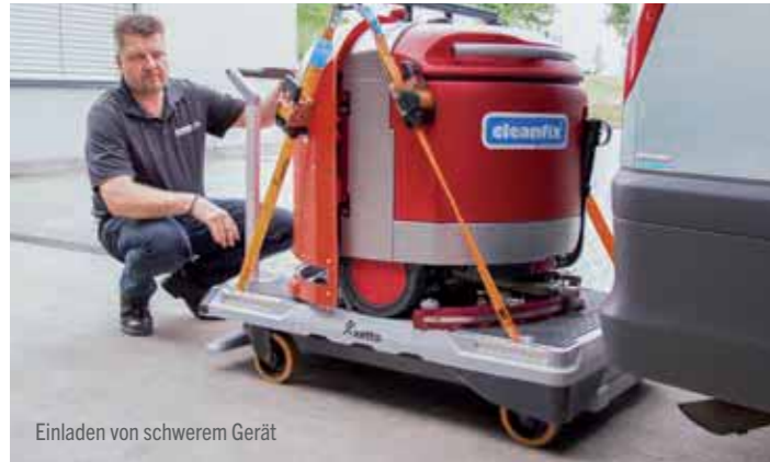
Einladen von schwerem Gerät